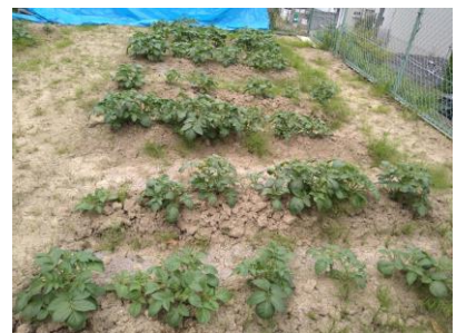
4月20日 芽かき前の写真