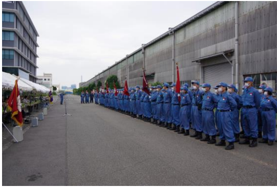
磯子消防団員の整列

7月3日(日)に行われた、標記大会で中原地区担当の磯子消防団第5分団が優秀な成績を収めました。日ごろの訓練・練習の成果が発揮されたものと思います。これからも訓練等に励み中原地区の安全安心を守っていきたいと思っています。